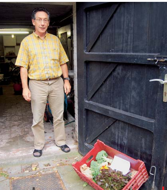
Jednou týdně otevřít garáž, aby měl farmář kam složit přepravky biozeleniny.

zону a za to si mohou kdykoli sklídit to, co potřebují. „Je o to ohromný zájem, mám sto dvacet zákazníků a dlouhý seznam čekatelů. Teď kupuji nové pozemky, abych mohl uspokojit ještě jednu tolik lidí,“ plánuje Troonbeeckx.